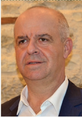
Νίκος Σουλιώτης Δήμαρχος Καρπενησίου